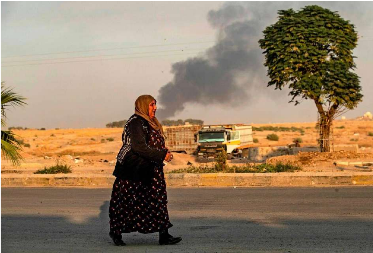
Kuzey ve Doğu Suriye kenti Gire Spi'de savaşın ortasında bir kadın.

Köylerden şehirlere göçün toplumda fakat özelde kadında yarattığı en temel hasarlardan ve zorlanmalardan birisi bu oluyor. 90'lı yıllarda Kürdistan'da akıl almaz uygulamalarla zorunlu köy boşaltmalardan sonra kentlere gelen kadınların yaşadığı en büyük zorlanma beton yığınlarının arasında, ulaşamadıkları bir avuç toprak özlemiydi. Bu sadece tarımla, toprağa dayalı üretimle ilgili bir sorun alanı olmanın çok ötesinde bir durum. Kimliğinden ve kültürel karakterden uzak düşmenin getirdiği bir trajedidir. Amed'in güya lüks semtlerinde, mahalle aralarına yapılan tandırlar, o devasa sitelerin balkonlarına yapılan minyatür bahçeler bir nebze de olsa bu özlemi dindirme çabasıdır.